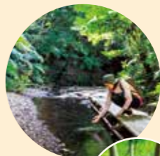
川裡的水冰冰涼涼的，相當舒適宜人。