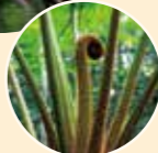
筆筒樹的新芽圓滾滾的，就像小貓的手。