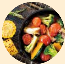
還能租借烤肉組。在森林中享用美食肯定好吃得格外令人難忘!

縣民之森內的露營場占地寬廣，能夠設置超過100張露營帳篷。除了完備的野炊場、廁所、淋浴間等設施，也提供帳棚、桌子等露營用品租借，讓訪客輕輕鬆鬆就能前來露營。在森林圍繞下的地點令人感到舒適，晚上更能仰望滿天星空。