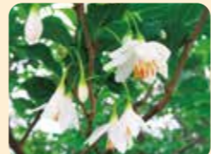
12月至3月則能觀賞野茉莉的花。