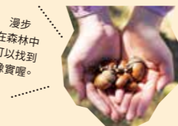
漫步在森林中可以找到橡實囉。

山頂眺望的風景也被盛讚為「絕景」。園區內要登上熱田岳有三條路線可選。三條路線的規畫都很完善，即使是登山新手或小朋友也能輕鬆走，沿途觀察自然生態，悠哉地健行到山頂上。標高165公尺的山頂視野開闊，可以遠眺本部半島及伊江島。5月會有西南木荷的花朵盛開，秋季會有日本石櫟結出橡實，可以尋找看看喔。