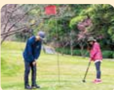
公園高爾夫的用球較大，讓初學者能夠玩得開心。兩個路線都有9洞。